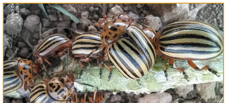
Adultos de escarabajo de la patata

Para su control es importante una buena planificación de los tratamientos. Se recomienda realizar el primer tratamiento antes de que las primeras larvas se tiren al suelo para pupar. Si el nivel de población no es elevado, el tratamiento se puede realizar por rodales. También es muy importante rotar materias activas para prevenir posibles resistencias.