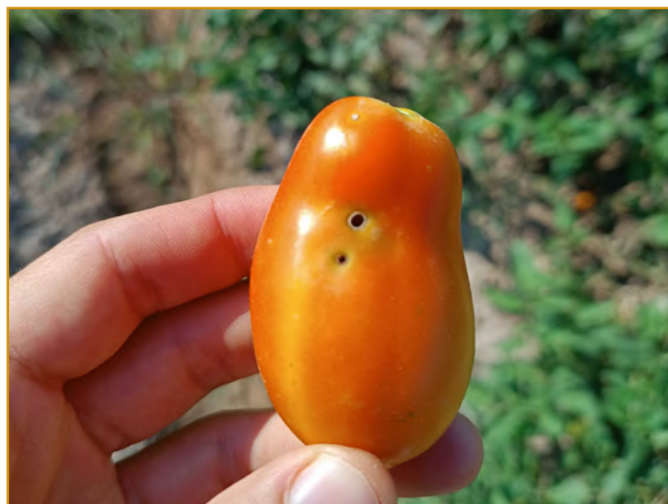
Daños de taladro en fruto

Los tratamientos para controlar esta plaga, se deben realizar cuando el cultivo tiene al menos dos racimos cuajados y se observa algún fruto picado con larvas L1-L2. Si el tratamiento se realiza cuando la larva es superior a L2 resulta muy dificultoso su control, sobre todo si ésta se encuentra en el interior del fruto.