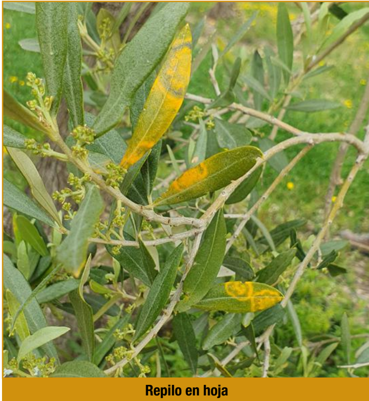
Repilo en hoja

La forma de realizar el control así como los productos a utilizar aparecen en el boletín fitosanitario Nº 2 del mes de marzo-abril .