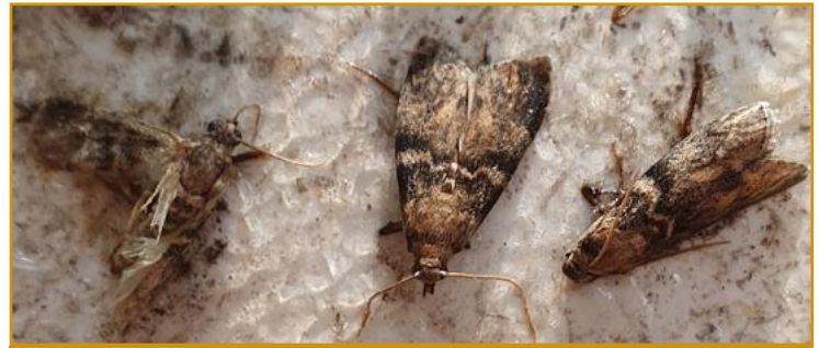
Adultos de euzofera en trampa

rizadas son: spinetoram 25%WG (DELEGATE WG-Corteva) y lambda cihalotrin 10%CS (exclusivamente los productos comercializados con número de registro 25882).