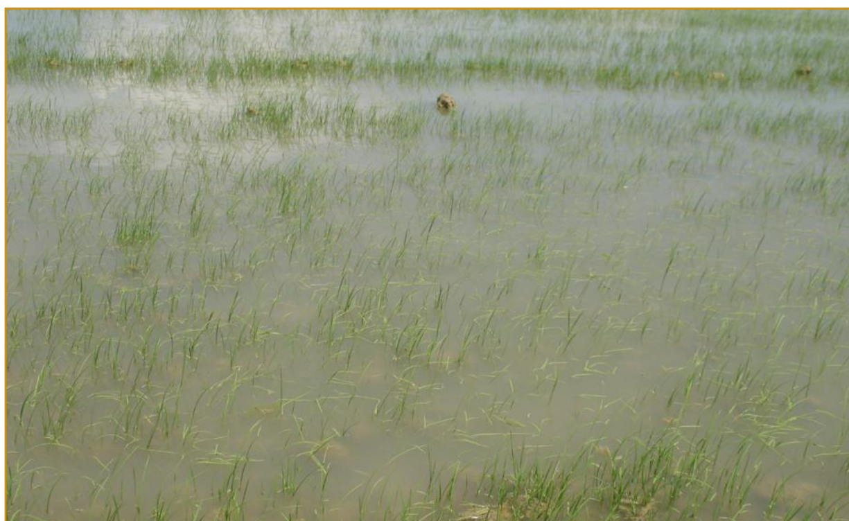
Campo de arroz con elevada infestación de Echinochloa spp. (son las hojas tumbadas al nivel de la lámina de agua).

(1) En aplicaciones tempranas. (2) Sólo controla Echinochloa crus-galli . (3) Control más efectivo para E. oryzicola/oryzoides que para E. crus-galli . (4) En primeros estadios el control pasa a bueno (B). (5) Necesario un tratamiento temprano para control de E. oryzicola y E. oryzoides ; controla E. crus-galli y E. hispidula también en estadios más avanzados. (6) Puede haber biotipos resistentes.