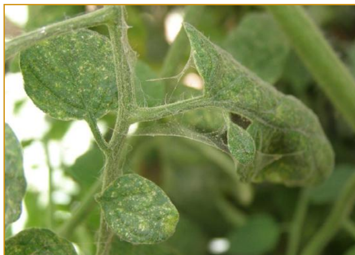
Síntomas de araña en tomate

Cuando sea necesario se deberá tratar con un acaricida autorizado en el cultivo mojando bien las hojas.