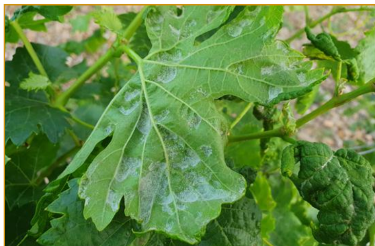
Erinosis: envés de una hoja con agallas

hacia el haz. Vistas por el envés, las agallas presentan una especie de pilosidad blanquecina. Raramente afecta al racimo. Es fácil de encontrar en muchas viñas, pero no precisa de tratamiento salvo en ataques muy severos.