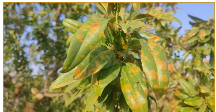
Síntomas de mancha ocre

Las aplicaciones realizadas en este cultivo con fungicidas autorizados contra otras enfermedades pueden presentar cierto efecto sobre la mancha ocre.