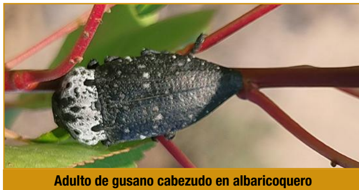
Adulto de gusano cabezudo en albaricoquero

Los adultos de este coleóptero son visibles en los frutales desde hace semanas y lo serán hasta bien entrado el otoño. En aquellas parcelas en las que se hayan observado daños por gusano cabezudo en años anteriores, se recomienda comenzar las aplicaciones a principios de junio con el objetivo de eliminar los adultos e intentar evitar la puesta. Para ello se puede emplear acetamiprid 20%SG, 20%SP (varios) en albaricoquero, cerezo, ciruelo y melocotonero y 20%SL (CARNADINE-Nufarm) en ciruelo. En el cultivo del almendro la única materia activa autorizada que se pueden usar contra el gusano cabezudo es acetamiprid 20%SG (GAZEL PLUS SG- BASF) . El plazo de seguridad de todos los productos citados es de 14 días.