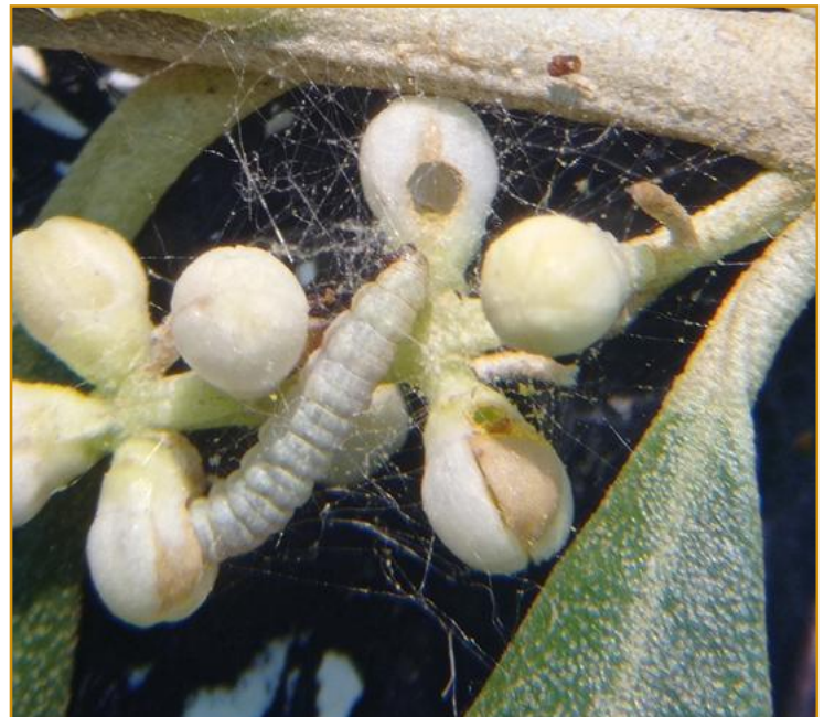
Larva de prays en ramillete floral (generación antófaga)

Generación carpófaga: La segunda generación es la que produce daños, ya que es la responsable de la caída de frutos en el mes de septiembre, cuando la larva sale del interior del hueso de la oliva.