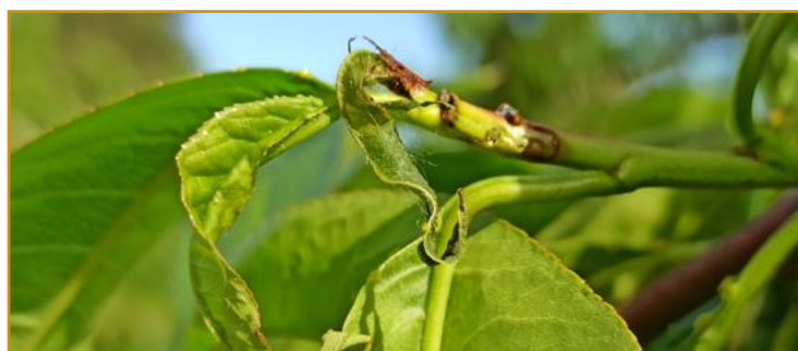
Brote de melocotonero afectado por polilla oriental

Cydia funebrana y Cydia pomonella , únicamente atacan a ciruelos y albaricoqueros respectivamente y sus daños pueden estar presentes desde los primeros días de mayo hasta la recolección. Por otra parte, anarsia y polilla oriental pueden atacar a las tres especies frutales, en este caso deben vigilarse las parcelas y en caso de apreciar brotes picados, efectuar 2 tratamientos separados entre sí 12 días. El riesgo de sufrir daños en el fruto se acrecienta en las 4-5 semanas previas a la recolección, razón por la cual la vigilancia deberá extremarse.