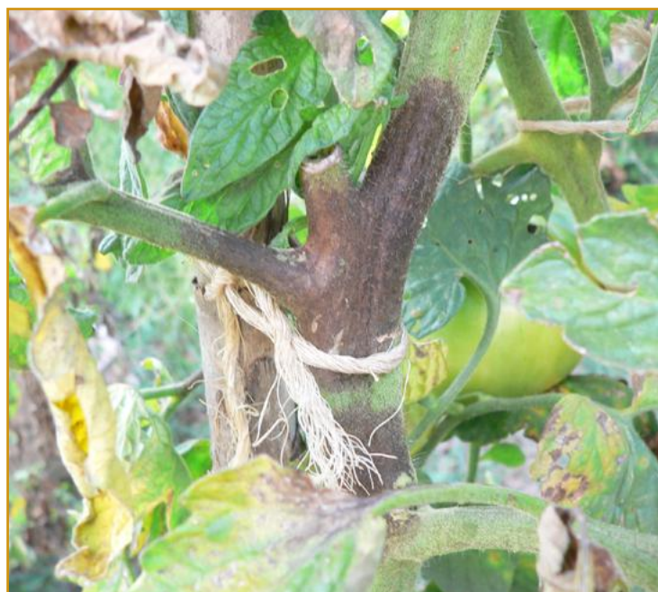
Daños de mildiu en tomate

Si se observan daños, los tratamientos se realizará necesariamente con productos sistémicos. Se recomienda siempre alternar estos productos con otros de contacto o penetrantes para evitar la aparición de resistencias.