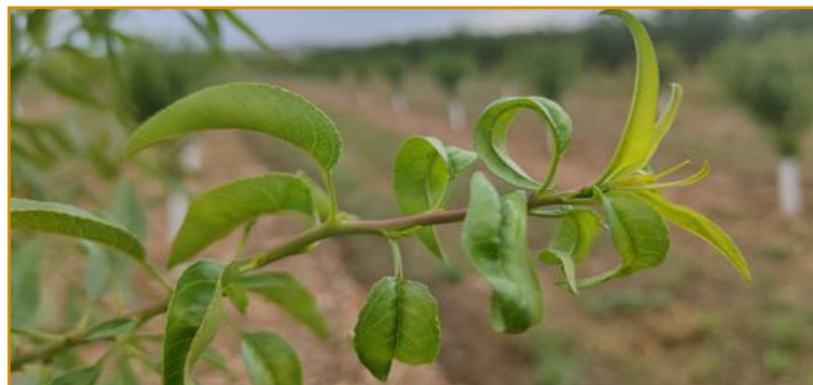
Brote de almendro atacado por mosquito verde

Deben vigilarse especialmente los viveros y las plantaciones jóvenes de almendro y melocotonero puesto que son en estos cultivos, donde los daños que producen las formas móviles de este insecto son más relevantes. Consisten en una notable reducción del desarrollo de los brotes, la proliferación de ramos "anticipados", deformaciones de brotes y enrollamiento y pérdida de color de las hojas. La existencia de malas hierbas en la parcela, así como en los márgenes de los campos vecinos, causa reinfestaciones que hacen más difícil la lucha contra el mosquito verde. En el cuadro siguiente se indican los productos autorizados para el control de esta plaga.