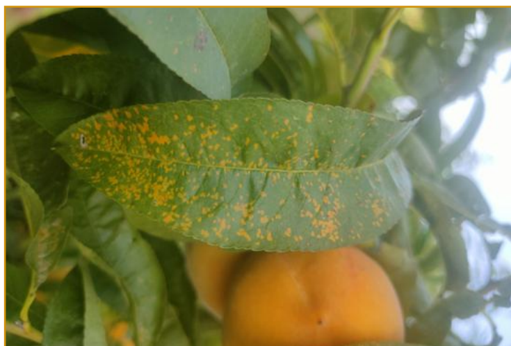
Síntomas de roya en hoja de melocotonero