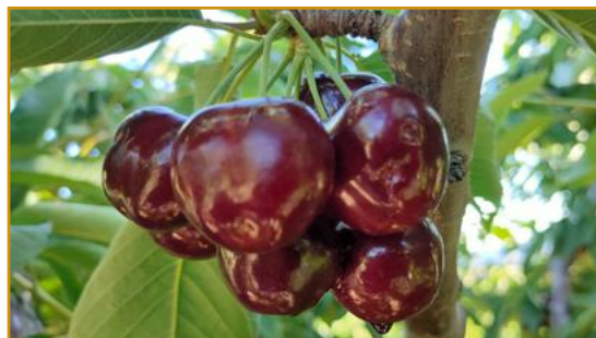
Cerezas atacadas por D. suzukii

Las condiciones meteorológicas determinarán probablemente la incidencia de esta plaga. Especialmente si se producen lluvias frecuentes y temperaturas suaves a partir del cambio de color de la cereza, será conveniente vigilar las parcelas para detectar la presencia de este díptero. Mayores riesgos de sufrir este problema tienen los cerezos localizados cerca de parcelas abandonadas, montes, pinares, estanques, cursos de agua, etc.