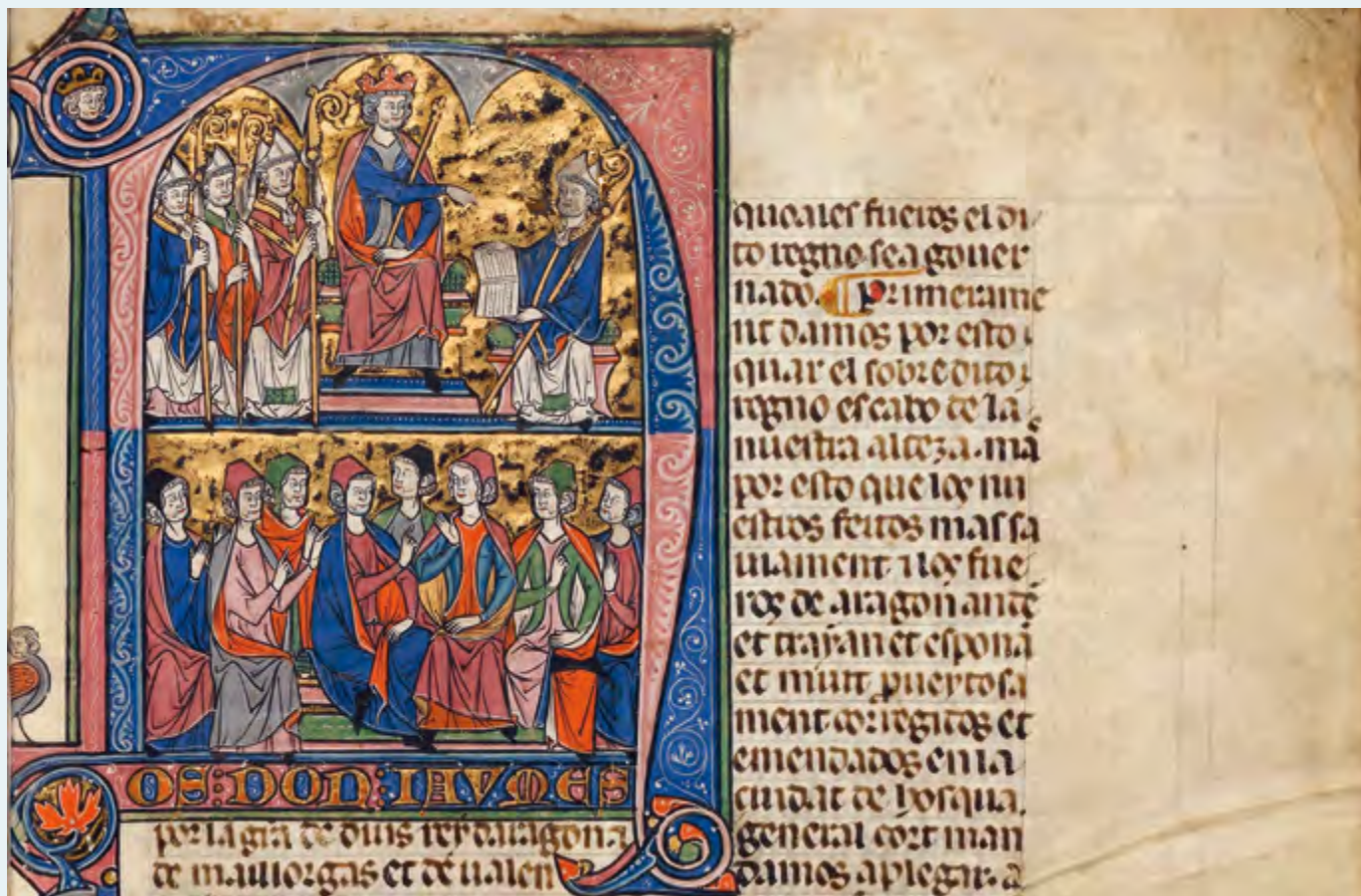
Fragmento del «Vidal Mayor». Primera compilación del Fuero de Aragón redactada por el Obispo de Huesca Vidal de Canellas, entre 1247 y 1252.

Concepción Gimeno Gracia Justicia de Aragón