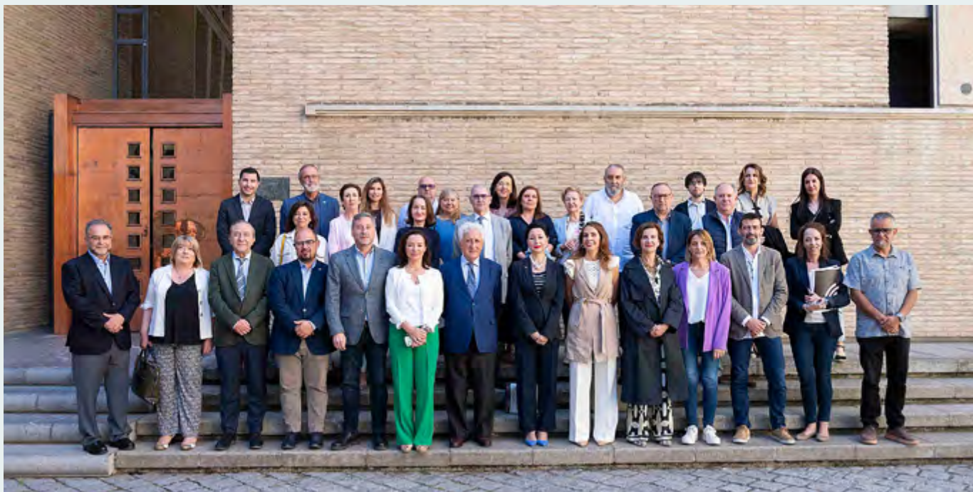
Fotografía tomada en las Cortes de Aragón tras la aprobación de la Ley 3/2024, de reforma del Código del Derecho Foral de Aragón en materia de capacidad jurídica de las personas.