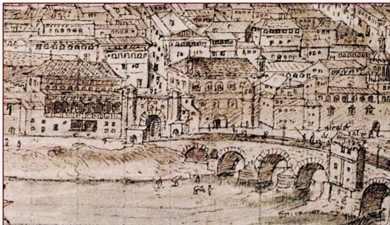
Vista de Zaragoza de Anthonius van den Wyngaerde (1563) Detalle de las Casas del Reino

Los millares de documentos emanados de este tribunal se hallan en buena parte dispersos por todo el territorio aragonés allí donde llegaban copias de las resoluciones judiciales del Justicia y sus lugartenientes. La mayoría de los procesos se han conservado entremezclados con los demás documentos judiciales de la antigua Audiencia, en el Archivo Histórico Provincial de Zaragoza. Concretamente están identificados como procedentes de la corte del Justicia de Aragón 987 procesos civiles, incoados entre los años 1381 y 1711. Tratan sobre los temas más diversos objeto de controversias civiles y han sido inventariados, indizados y publicados en DARA.