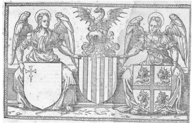
Escudos de Aragón. Portada de la Historia del rey D. Fernando de Jerónimo Zurita

Tribunal que representaba la justicia impartida por el monarca, creado por Fernando el Católico a finales del siglo XV. En las diferentes reformas del siglo XVI quedó definida su composición y sus atribuciones: entendía de procesos civiles en cuantía superior a una determinada cantidad, de