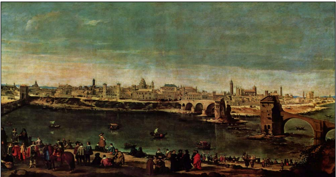
Vista de Zaragoza en 1646. Martínez del Mazo. Museo del Prado. Al fondo, tras el puente de piedra, edificio de la Diputación del Reino

Sin embargo, en este primer tercio de siglo el tráfico comercial por el territorio no fue abundante, lo que repercutió en los ingresos de