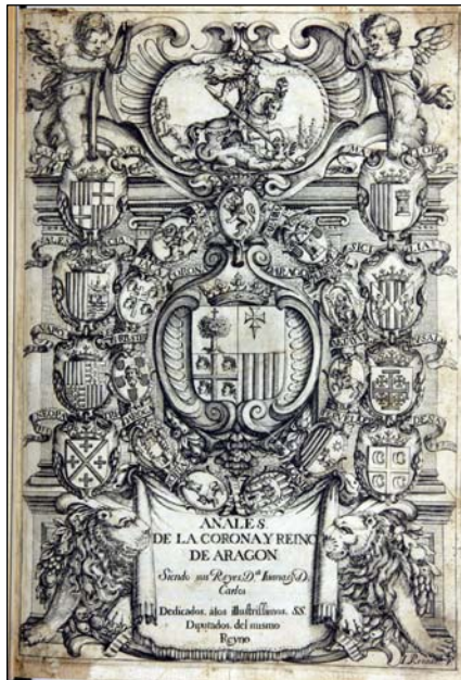
Anales de la Corona y Reino de Aragón. B. Leonardo de Argensola

La derrota austracista y la aplicación política de Felipe V cambiaron de forma trascendental algunas estructuras administrativas e identitarias de Aragón. En tal proceso metamórfico se silenció definitivamente la pluma del reino, prevaleciendo la opinión del rey con la connivencia de sus viejos y de sus nuevos adeptos aragoneses.