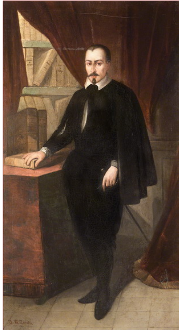
Jerónimo Zurita, por Nicolás Ruiz de Valdivia Diputación Provincial de Zaragoza, Palacio de Sástago.

En 1578 y 1579 Zurita estuvo en la capital del Reino aragonés con permiso real e inquisitorial (no consiguió la deseada jubilación), de modo que pudo atender directamente sus estudios