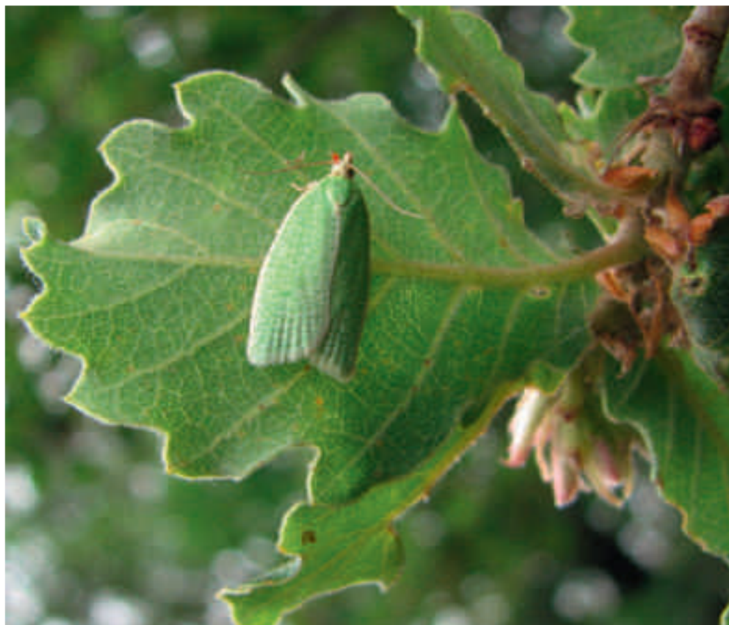
Fig. 1. Insecto adulto de Tortrix viridana .