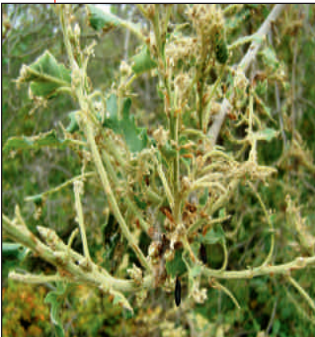
Fig. 6

Fig. 2. Refugio de la oruga hecho con hojas.