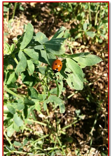
Fauna auxiliar: coccinela en alfalfa

Si se observa presencia abundante de pulgones y siempre que la plaga se encuentre lo suficientemente localizada, se recomienda concentrar la aplicación de tratamientos en los focos o rodales (consultar productos en el Boletín N° 1 enero-febrero).