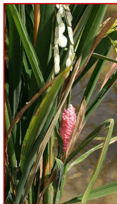
Puesta de huevos de caracol

En Aragón no se ha detectado la presencia de esta plaga. Ante la sospecha de la presencia en su parcela, deberá ponerse en contacto con el Centro de Sanidad y Certificación Vegetal o con los técnicos de las ATRIAS de arroz.