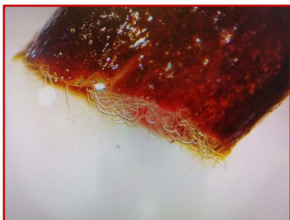
Detalle de ejemplares dentro de la agalla

La bolsa o agalla tiene forma oval alargada, es de menor tamaño que el propio grano de la cebada. El color cambia de verde a pardo oscuro casi negro en función de la maduración de la espiga.