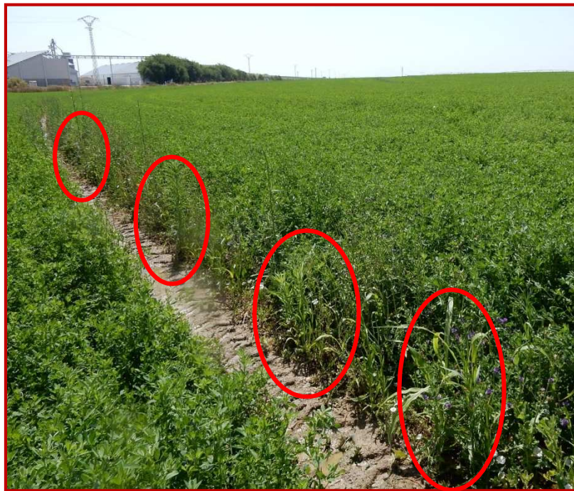
Plantas de teosinte a lo largo de la rodada del sistema de riego en pivot en una parcela de alfalfa

NOTA: EN CASO DE ENCONTRAR O TENER LA SOSPECHA DE LA PRESENCIA DE TEOSINTE DEBERÁ AVISAR AL CSCV.