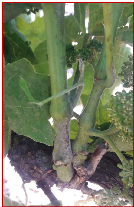
Oidio en sarmiento

Hasta el momento en esta campaña, las detecciones de desarrollo de este hongo están siendo bajas. En las zonas de Cariñena y Borja se han detectado daños muy puntuales. Aquellos cuya afección es considerable son puntos que la campaña anterior acabaron con un ataque destacable.