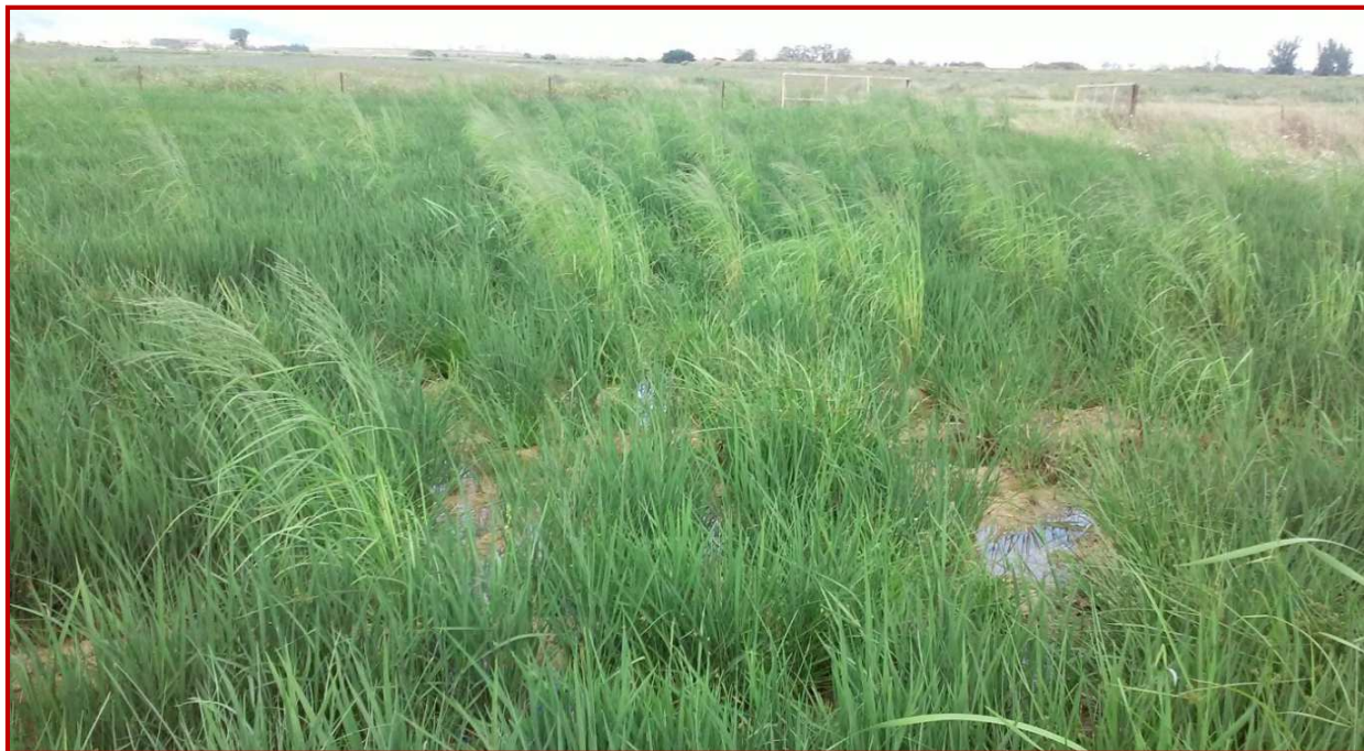
Aspecto de una parcela de arroz con infestación de Leptochloa spp. Se observan las inflorescencias que maduran antes que el arroz