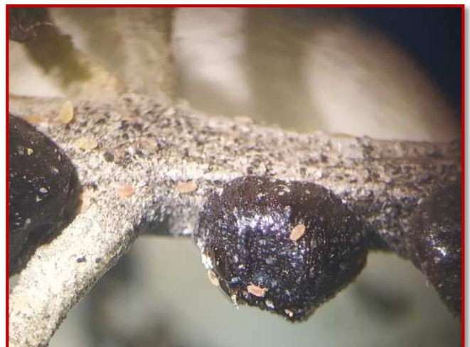
Adulto y larvas de cochinilla

Los tratamientos solo se realizarían cuando haya mucha densidad de plaga. Estos se aplicaran antes de alcanzar el estado adulto que suele ser en el mes de septiembre. Los tratamientos para mosca y prays también controlan la cochinilla. Los productos recomendados aparecen en el Boletín Nº 3 (mayo-junio).