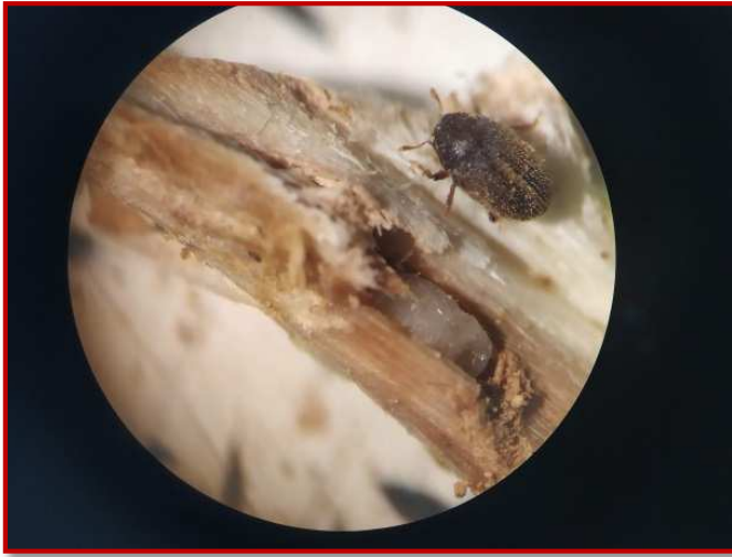
Pupa y adulto

Se ha podido determinar que el estado evolutivo del barrenillo negro está ligado a la fenología del olivo, de forma que la salida de adultos se produce en el estado fenológico de fruto cuajado (G) , en los 10 días siguientes a la caída de pétalos es cuando el tratamiento será más efectivo.