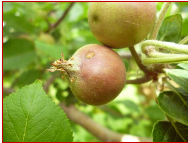
Daños de moteado en manzana

A partir de ahora y hasta prácticamente la recolección, en aquellas parcelas en las que se han detectado daños por moteado, podrán encontrarse infecciones secundarias si continúan las lluvias o intensos rocíos, por lo que será imprescindible seguir protegiendo los cultivos en caso de riesgo. Los fungicidas autorizados para ello se indicaron en el Boletín N o 2.