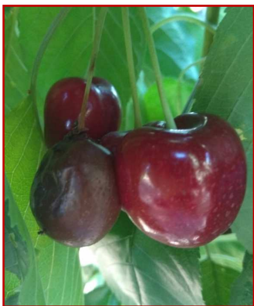
Cerezas afectadas por D. suzukii

Los daños producidos por esta plaga a lo largo de la presente campaña, han sido relevantes en algunas parcelas de las variedades más tempranas en las zonas de recolección precoz y media. Por ello, es imprescindible la vigilancia de las plantaciones y si es preciso efectuar tratamientos para el control, en especial si se dan las condiciones climáticas adecuadas (altas humedades relativas y temperaturas suaves, entre 24 y 27°C). Es conveniente extremar la vigilancia de las parcelas, sobre todo de aquellas que se encuentren en zonas elevadas, próximas a terrenos de monte o cursos y masas de agua.