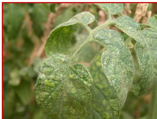
Daño de araña en tomate

Con el aumento de temperaturas, es importante vigilar los distintos cultivos hortícolas, ya que la aparición de ácaros puede verse favorecida por estas condiciones. Los daños suelen iniciarse en la parte inferior de la planta y en el envés de la hoja, zona a la que hay que prestar atención para detectar su presencia. Si se observan daños se deberán realizar tratamientos con los productos recomendados en el Boletín N° 3. Si no se realizan los tratamientos en el momento adecuado los daños pueden llegar a ser muy importantes.