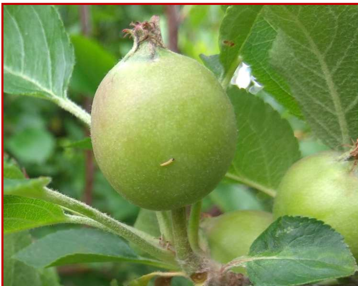
Larva de carpocapsa deambulando en una manzana

Aquellas parcelas que han presentado en años anteriores daños elevados, deben ser controladas periódicamente. En ellas se deben buscar las penetraciones recientes, teniendo en cuenta que las larvas acostumbran a formar galerías en los puntos de contacto de unos frutos con otros, o de ellos con una hoja o rama, en el peral es frecuente la penetración por la zona de la fosa calicina. Mediante estos controles y la observación del número de adultos capturados en las trampas de monitoreo, se podrán determinar de manera adecuada los momentos críticos del ciclo biológico de la plaga. El control en estas parcelas debe de ser máximo, de manera