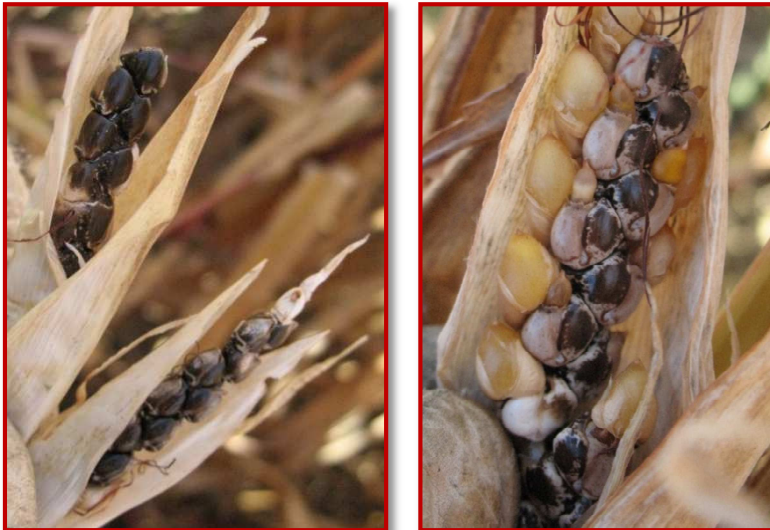
Aspecto de diferentes tipos de semillas de teosinte que se pueden encontrar en estado de madurez

Durante los meses de mayo y junio pueden emerger plántulas de esta mala hierba en las zonas afectadas en años anteriores, pero éstas son difíciles de diferenciar del cultivo de maíz . Si emergen plantas que tengan apariencia de maíz, pero está fuera de la línea de siembra puede sospecharse que sea teosinte. Para confirmarlo, no obstante, habrá que arrancar con cuidado la plántula para intentar sacar la semilla y poder observar la coloración oscura correspondiente a teosinte.