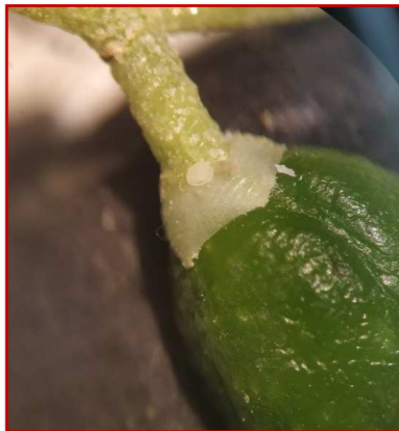
Huevo de prays en fruto

El caolín recubre los frutos evitando la puesta, por tanto, el tratamiento se realizará cuando el fruto esté recién cuajado, antes de que la polilla realice la puesta.