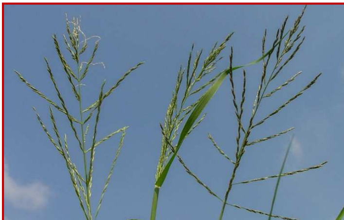
Detalle de las inflorescencias de Leptochloa spp. antes de madurar

La leptochloa es una mala hierba que, inicialmente, aparece en los márgenes de los campos de arroz y en zonas poco encharcadas , pero poco a poco puede ir colonizando el resto de la parcela. Su germinación escalonada, la gran capacidad de ahijamiento y la elevada producción de semillas, son los aspectos que favorecen que prolifere. A esto hay que añadir que el control químico en arroz mediante herbicidas es ineficaz. Afortunadamente, esta especie es sensible al encharcado continuo, por lo que en parcelas en las que la lámina de agua es elevada y constante se mantiene solo en los márgenes o en zonas menos encharcadas.