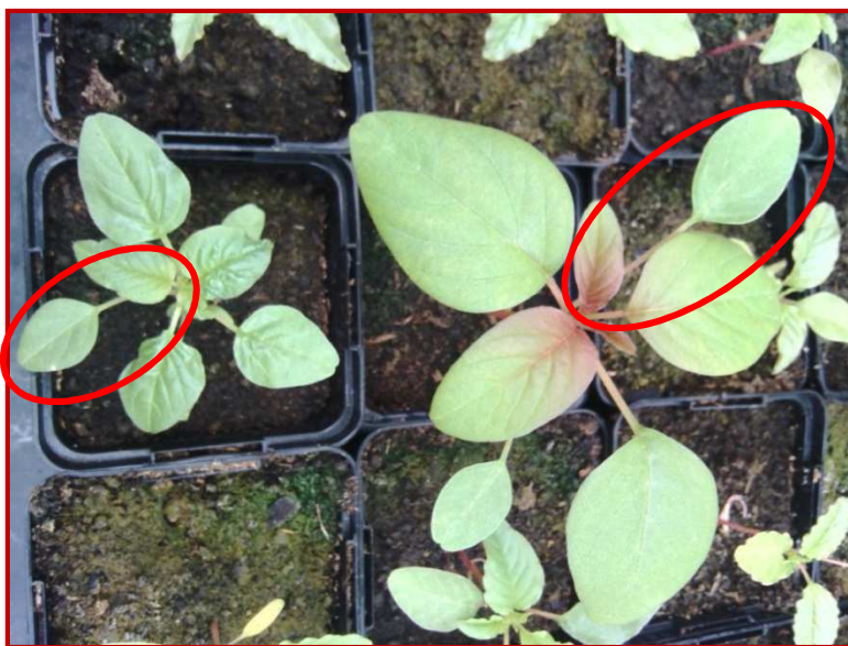
Plántulas de A. palmeri donde se aprecia que las hojas más antiguas tienen los peciolo mucho más largos que el limbo de la hoja

Esta especie invasora, que se encuentra en pocos países del mundo, apareció en Aragón hace pocos años en bordes de caminos. Tras las prospecciones que el Centro de Sanidad Vegetal realizó la campaña del 2018, además de en campos de maíz, se ha detectado en varios campos de frutales, barbechos de cereal y forraje (alfalfa y festuca).