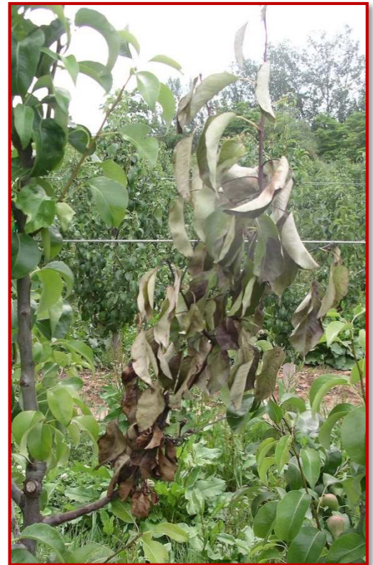
Rama de peral afectada por fuego bacteriano

Dentro de las prácticas culturales que se pueden llevar a cabo para luchar contra la enfermedad, se encuentra el no realizar podas en verde en periodos húmedos y la limitación del abonado nitrogenado con el objetivo de evitar una excesiva brotación y un elevado vigor.