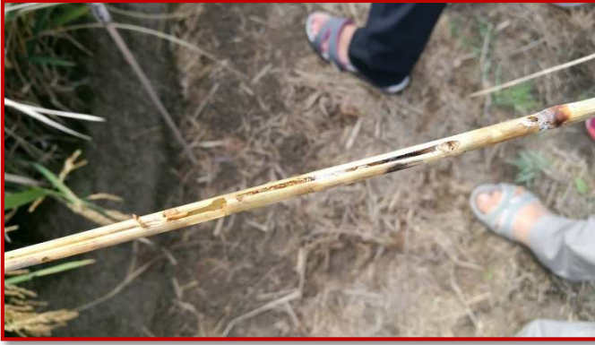
Detalle de caña barrenada

Es un lepidóptero de hábitos crepusculares, de la familia Crambidae, llamado coloquialmente, taladro o barrenador del arroz.