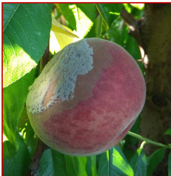
Melocotón afectado por monilia

Debido a las lluvias producidas durante el mes de mayo, algunas parcelas de cereza han sufrido el agrietado de los frutos. Cuando esto ocurre, las conidias del hongo causante de la monilia se introducen por las heridas abiertas produciendo unas pequeñas manchas pardas que evolucionan rápidamente a podredumbres, siendo capaces de infectar a aquellos frutos cercanos que estén sanos. Esto ocurre en cerezo, pero en otros frutales de hueso, las zonas de entrada pueden ser provocadas por otras causas como daños por pedrisco o ataques de plagas. Estas heridas, en condiciones de elevada humedad y temperaturas suaves, pueden desembocar en daños por monilia. Además, las infecciones pueden quedar latentes, apareciendo posteriormente en los procesos de almacenaje o comercialización.