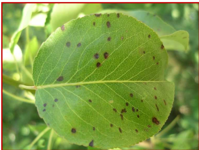
Hoja de peral atacada por septoria

Los síntomas de esta enfermedad pueden comenzar a observarse desde mediados de abril si se dan condiciones climáticas semejantes a las que hemos tenido durante los meses pasados en nuestra comunidad (humedades relativas altas y temperaturas suaves). La septoria se manifiesta en primer lugar en las hojas, con un número variable de manchas de forma más o