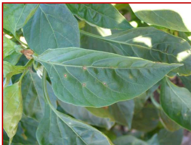
Síntomas en hoja

Cuando se dan las condiciones climáticas adecuadas, y sobre todo tras tormentas de verano hay que prestar atención a Xanthomonas vesicatoria en pimiento. La prevención y una detección temprana es fundamental, ya que no hay tratamientos para su control. Los primeros síntomas se manifiestan en las hojas como pequeñas manchas de aspecto acuoso de 2-4 mm de diámetro, que cuando evolucionan se necrosan, desecan la hoja y toman aspecto apergaminado con el borde oscuro. La utilización de semilla libre de patógeno, la rotación de cultivos, así como la vigilancia constante de las parcelas, la eliminación de las plantas con síntomas y la desinfección de herramientas y aperos son algunas medidas efectivas para evitar su propagación.