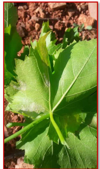
Mildiu en el envés de la hoja

En estos momentos en que el hongo puede estar en los