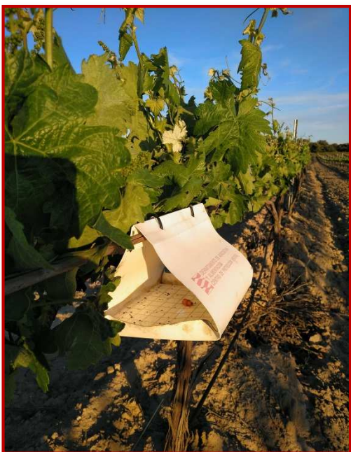
Trampa de polilla del racimo

En las zonas en las que la confusión sexual está implantada, las capturas en estos últimos meses han sido escasas; la confusión está siendo efectiva. En las zonas donde no hay confusión y coincidiendo con que son zonas más tardías, se están empezando a contabilizar los primeros adultos en trampa.