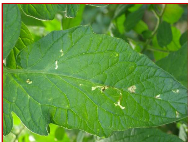
Daño de tuta

Durante el mes de mayo se han observado algunos vuelos de Tuta en invernadero. Se deben vigilar las plantaciones de tomate de mercado, especialmente en cubiertas bajo plástico. Se trata de una plaga muy influenciada por las temperaturas, y el aumento de las mismas puede provocar incrementos importantes en el nivel de plaga. En caso de detectar su presencia se deben seguir las indicaciones del Boletín N° 3.